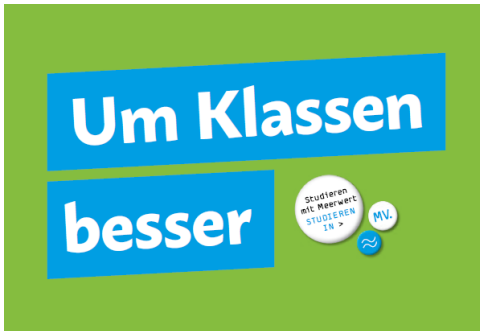
Motiv für die Metroboards

Alle Motive sind auch auf dem Portal der Hochschulmarketingkampagne des Landes veröffentlicht: www.studieren-mit-meerwert.de/kampagnenmotive/