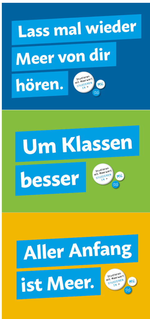
Motive der Postkarten

In Kooperation mit der Hochschule für Musik und Theater Rostock.