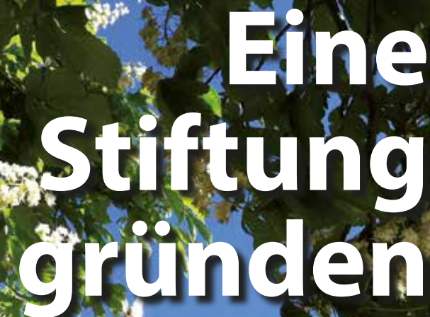
Katy Hoffmeister Justizministerin Mecklenburg-Vorpommern

Email: presse@jm.mv-regierung.de Homepage: www.jm.mv-regierung.de